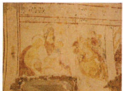
Restiello: Lamentaciones sobre Cristo muerto