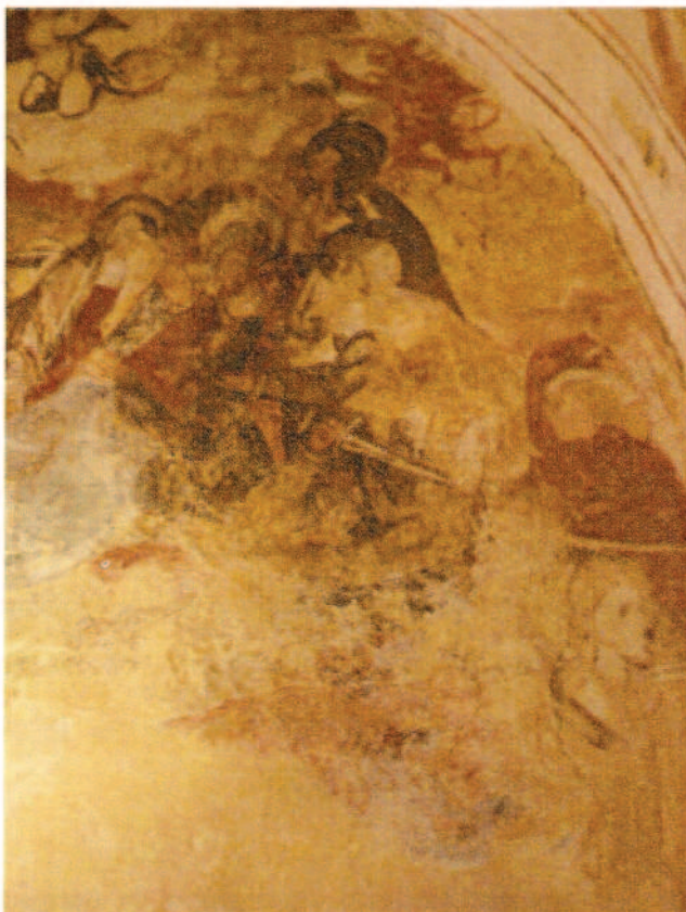
Muro Testero: Grupo de dolientes

acompañaron a la Virgen y aparecen juntas en diferentes episodios de la Pasión. Ninguna de ellas presenta una iconografía clara por lo que es imposible identificarlas individualmente. Una se representa agachada y frontal - vestida de rojo y blanco - y la otra de pie y de perfil, totalmente vestida de negro. Una tercera mujer se adivina a la derecha de María, agachada y de perfil, sujetando al igual que las otras, el cuerpo de la Virgen. La mala conservación de la pintura nos impide verla con claridad, ocultando posibles rasgos iconográficos que nos ayuden a su identificación. Podría tratarse de la Verónica, santa imaginaria que aparece a finales del S. XV por la influencia del teatro de los Misterios. Esta santa conmovida de piedad seca con un velo el sudor que corría por el rostro de Cristo y en recompensa por este gesto piadoso ella recogió en el sudario la impresión de la Santa Faz. 5 Tras la Madre de Cristo, entre María Cleofás y María Salomé, asoma, muy desgastado, otro personaje de perfil mirando a Cristo y sosteniendo a María en el que reconocemos la imagen de San Juan.