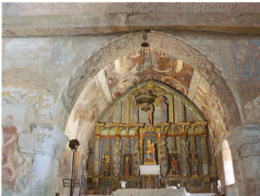
Pinturas de Celón. Allande