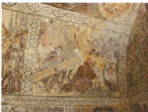
Celón: Cristo con la cruz a cuevas

Lo primero que nos llama la atención en las pinturas de Celón es la tendencia al “ horror vacui ”, todas las escenas aparecen recargadas de personajes que apenas dejan sitio para los espacios abiertos y en las pocas ocasiones que queda un espacio libre entre personajes el artista los rellena con la colocación de elementos arquitectónicos. En el caso de Restiello los fondos aparecen limpios y claros, sin alusión alguna a perspectiva o a elementos arquitectónicos. Las pinturas de Celón cuentan con gruesos trazos de color negro que delimitan los contornos y dibujan los plegados de los ropajes o los músculos de los cuerpos; Restiello, en cambio, da prioridad a los reflejos lumínicos y, a través de gradaciones tonales, consigue la volumetría de los personajes. Celón utiliza una gama cromática oscura y apagada mientras los colores de Restiello son más luminosos y brillantes.