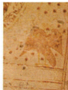
Bóveda: Dios Padre y detalles de tetramorfos