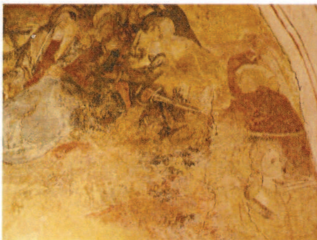
Detalle de la Crucifixión: Personajes que parecen luchar entre ellos.